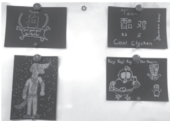
图1：差异化分组两组队名及口号