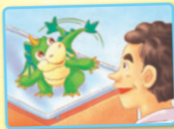
Bǎ wěibā dòng yí dòng. 把尾巴动一动。