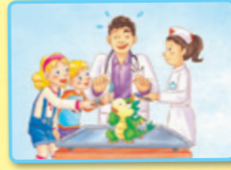
Bǎ bǐ ná gěi wǒ. 把笔拿给我。