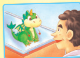
Bǎ shǒu fàng xià. 把手放下。