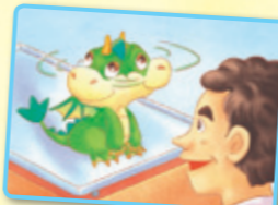
Bǎ tóu zhuǎn yí zhuǎn. 把头转一转。