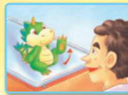
Bǎ jiǎo jǔ qǐ lái. 把脚举起来。