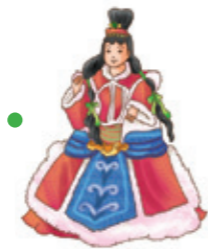
bùdàixì ǒu 布袋戏偶