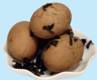
chá yè dàn 茶叶蛋