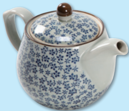
chá hú 茶壶