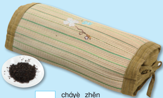
chá yè zhěn 茶叶枕

Nǐ zhī dào chá yè hái néng zuò shén me ma? 你知道茶叶还能做什么吗?