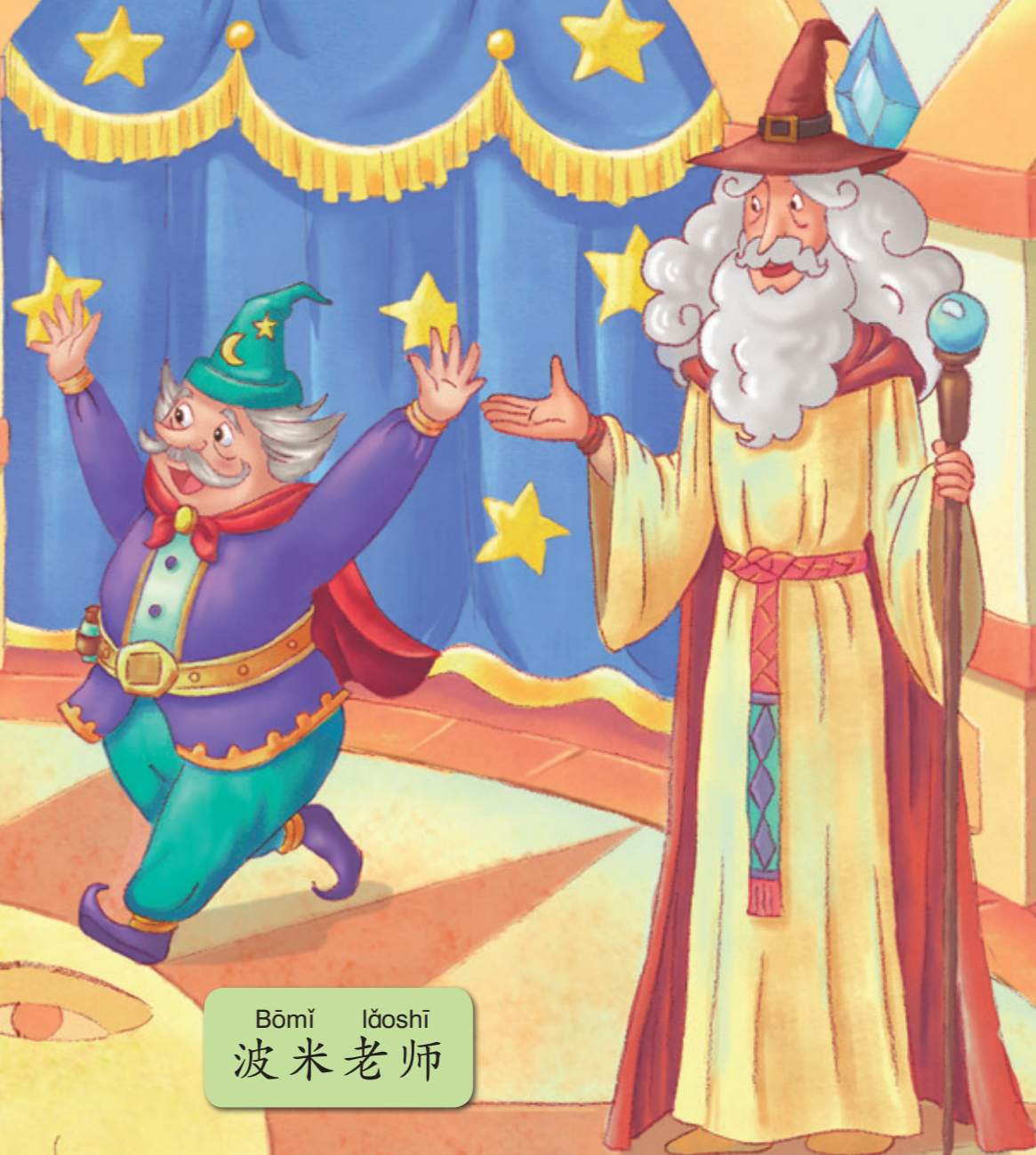
Bōmǐ lǎoshī 波米老师