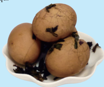
茶葉蛋 chá yè dàn