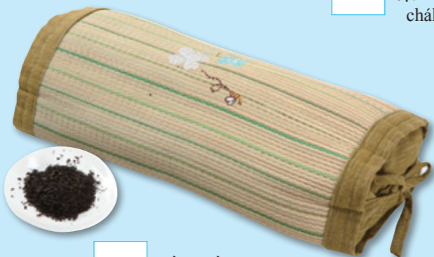
茶葉枕 chá yè zhěn